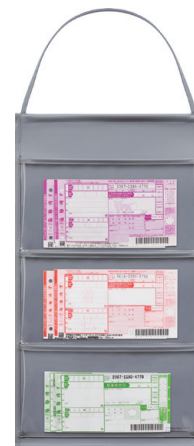
GR (グレー) 4990630480036