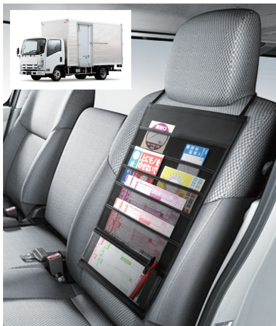
中の物が分かりやすいメッシュ素材のフラットポケットと 下段は透明マチ付きポケット (W-481)