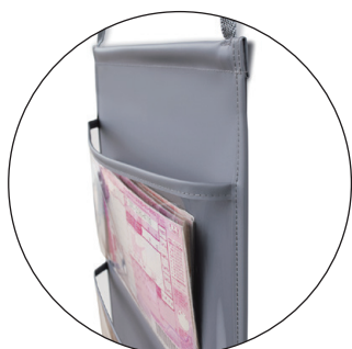
中の物が一目で分かる透明マチ付きポケット 収納・保管に最適 (W-480)