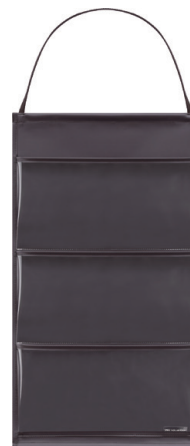
BR (ブラウン) 4990630480098