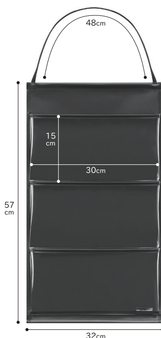
BK (ブラック) 4990630480012