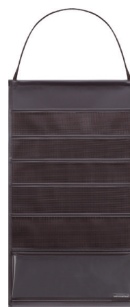
BR (ブラウン) 4990630481095