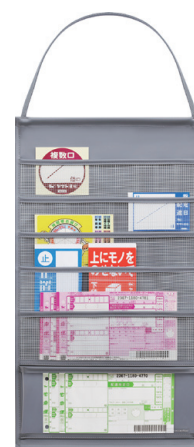
GR (グレー) 4990630481033