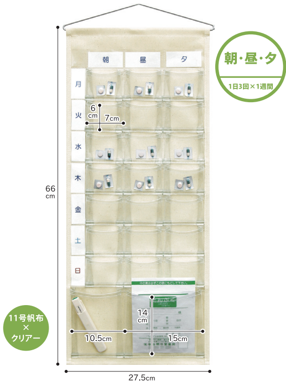
27.5cm キナリ 4990630610198

SIZE W34 × H68 cm (ポケットマチ3 cm) 材質 PVC (塩ビ)・プラスチックハトメ・上質紙 lot 1c / 3 pcs パッケージ フック付きOPP袋入り (W29 × H35 cm)