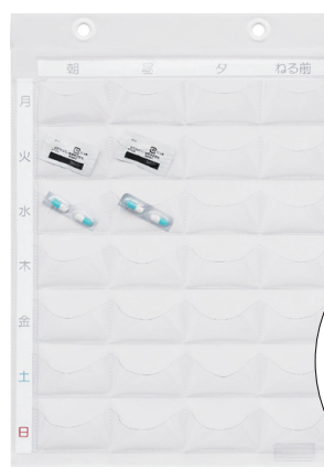
27.5cm W (ホワイト) 4990630162024