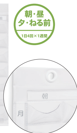
取り出しやすいマチ付ポケット