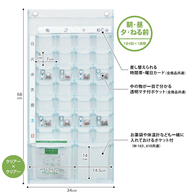
34cm CL (クリアー) 4990630165001

W-165 ウィークリー投薬ポケット (1日4回分用) ¥2,500 (税抜価格)