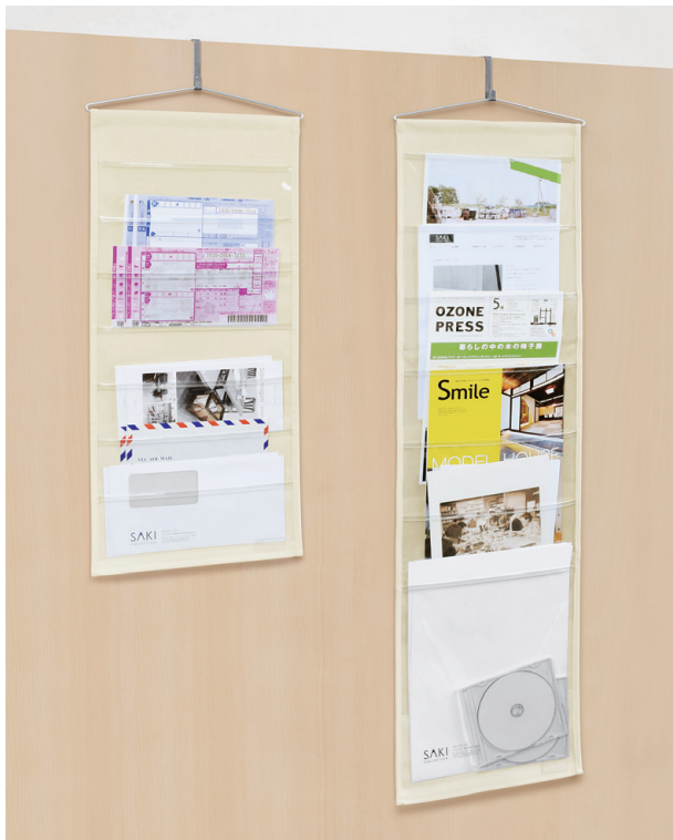
〈左/W-434 右/W-435 使用例〉 ※パーティション用のフックは、非売品です。

帆布(はんぷ)とは・・・ 帆船の帆に使われていた丈夫で厚手の綿織物です。 その他にテント地や画布などにも用いられています。 天然素材で環境にやさしい素材です。