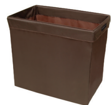
BR (ブラウン) 4990630332762