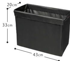
BK (ブラック) 4990630351756