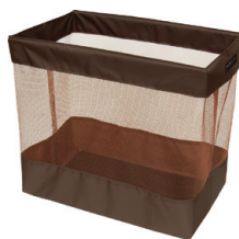
BR (ブラウン) 4990630330768