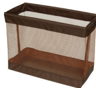
BR (ブラウン) 4990630350766