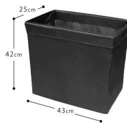
BK (ブラック) 4990630332755