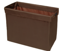
BR (ブラウン) 4990630351763