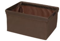
BR (ブラウン) 4990630333769