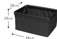
BK (ブラック) 4990630333752