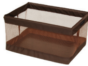
BR (ブラウン) 4990630331765