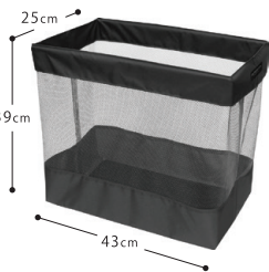
BK (ブラック) 4990630330751